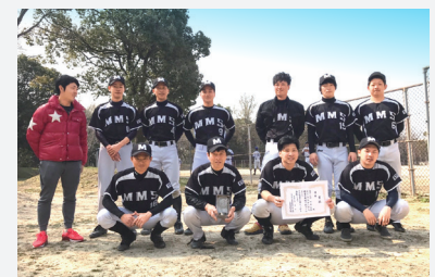
現在部員は15名ほど。チーム力向上のため、年齢・経験問わず募集中です!

2月18日(日)~3月25日(日)に開催された「夏季大会」で、MMS野球部が悲願の初優勝を果たしました。体力自慢のMMS社員のなかでも、若くてフレッシュな部員が揃う野球部。仕事外の時間を有効に活用し、日々レベルアップに励んでいます。