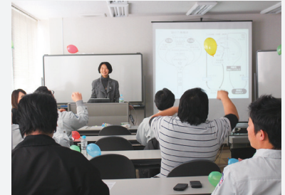
ヒューマンエラーを防ぐための脳力UPトレーニング

建設現場の最前線で活躍する従業員の安全を確実にするため、1月23日(火)社員研修を実施しました。脳のメカニズムに基づく安全への意識改善と、環境づくりのための脳力UPトレーニングを実施。実際の現場でも事前に危険を予知し、