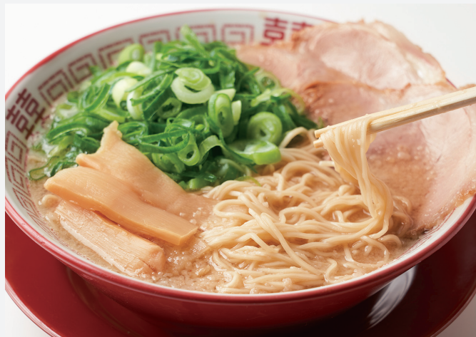
▲ほんのり甘いチャーシューが自慢の醤油豚骨ラーメン(並)660円。あっさりしたスープは、ランチにも、飲み会のあとのメにもぴったり!