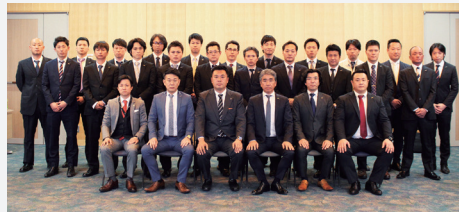
【第25期安全スローガン】