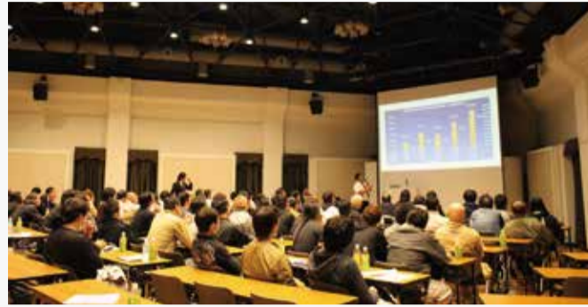
阪神安全大会出席者

大会では、日常でもなじみ深い安全運転をテーマに講話を実施。さらに現場で起こりうる事故・災害事例に基づき、事故の原因の究明、予防策を参加者全員が共有しました。最後には、今期の安全スローガン「見直すゆとりが 身を守るしなさいませない事故災害」を全員で唱和し、災害・事故ゼロと、業務の品質確保・向上を誓い合いました。