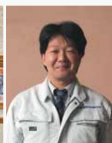
上野山SC長(梅田SC・難波SCを兼任)