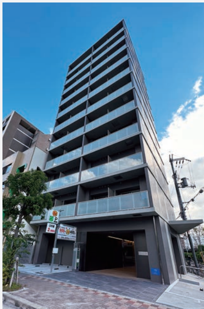
2023年5月に新築されたばかりのMMS-Ⅲ。

京都、滋賀に続き、3件目となる当社の賃貸物件「MMS-Ⅲ」を新大阪にオープンしました。今後は関西圏以外でも、MMSの受注エリアがある全国の大都市圏へと拡大予定です。